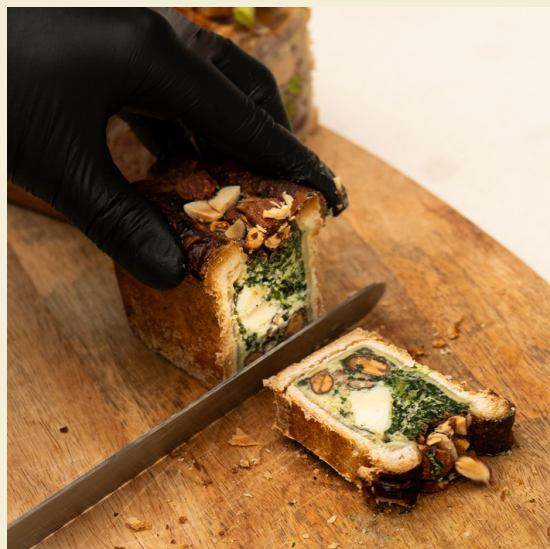
CHÈVRE - ÉPINARDS