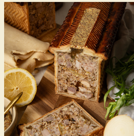
PEP'S ET FRAÎCHEUR